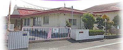
佐東地域交流会館 (旧佐東幼稚園)