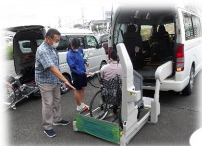
運転ボランティアの会