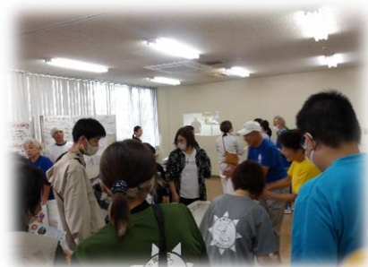
手話サークル太陽の会