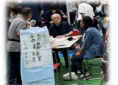
掛川視覚障害者協会