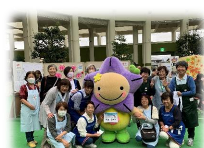
掛川市赤十字奉仕団