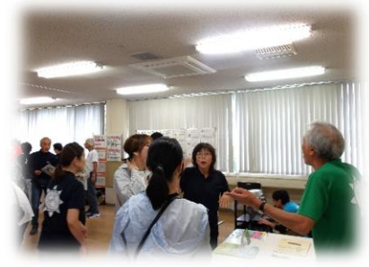
掛川市ろうあ福祉会