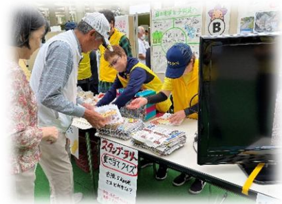
明るい社会づくり運動協議会