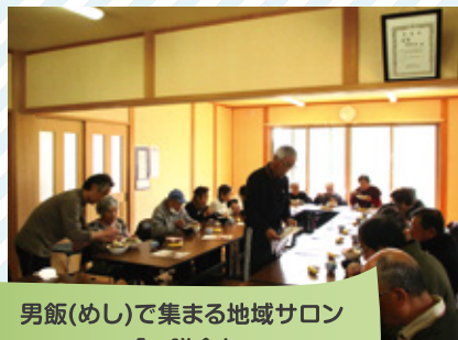
男飯(めし)で集まる地域サロン 「一膳会」 粟本地区 初馬区