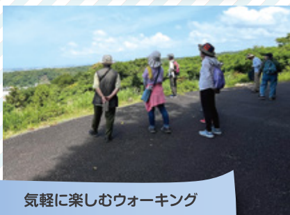
気軽に楽しむウォーキング 「柏平いきいきウォーク」 大須賀第一地区 柏平区

地域福祉活動には様々な形がありますが、「地域での暮らしを良くするため」という思いは共通しているのではないのでしょうか。今回の報告会を通して、地域で取り組まれている活動を知り、それぞれのいいところを参考にして、一緒に地域福祉活動を考えていきましょう。社協では今後もより多くの地域で生き生きとした生活を送ることができるよう福祉活動の推進を支援してまいります。