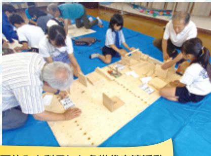
夏休みを利用した多世代交流活動 西郷地区