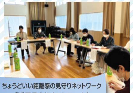
ちょうどいい距離感の見守りネットワーク 「浜区見守りネットワーク」 大淵地区 浜区