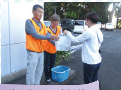
地区で取り組む困窮者支援 千浜西区