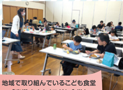
地域で取り組んでいる子ども食堂 「南郷すくすく子ども食堂」 南郷地区