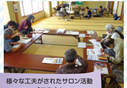
様々な工夫がされたサロン活動 「三寿会」 大坂地区 三井区