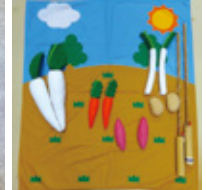
やさい収穫つりゲーム