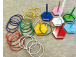
フリースタイル輪投げ