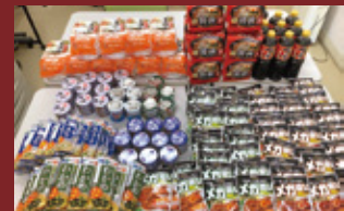
▲昨年度の寄付金で購入させていただいた食品の一部

スーパーサンゼン葛川店様にて期間中に対象商品を購入すると、その売上金額の一部が寄付金となるキャンペーンを行っています。この寄付金は掛川市社会福祉協議会が実施するフード支援活動に活用されます。昨年度は、126,758円のご寄付をいただき、生活にお困りの方にお渡しするための食品を購入させていただきました。