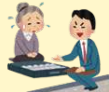
不利益な契約の防止