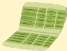
お金の管理・支払い