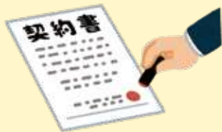
福祉サービスの契約